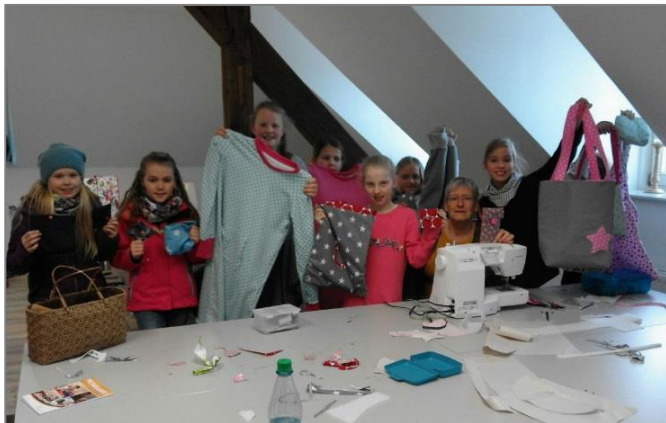
Tolle Nähkunstwerke von jungen Teilnehmerinnen.

Mitzubringen ist: eine Nähmaschine. Maximal sechs Kinder.